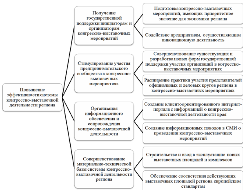
Рис. 1. Дерево целей для развития системы конгрессно-выставочной деятельности региона

В совокупности данные цели при условии их достижения должны способствовать реализации цели первостепенной важности – стратегической цели системы. Если представленная стратегическая цель будет достигнута, т.е. повысится эффективность системы конгрессно-выставочной деятельности региона, то региональные производители смогут более эффективно продвигать свою продукцию на внутренних и внешних рынках, повысится узнаваемость региона на международном уровне, что является следствием повышения конкурентоспособности региона.